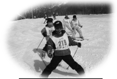
昨年の教室の様子