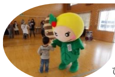
ひよっこクラブのお友達と握手